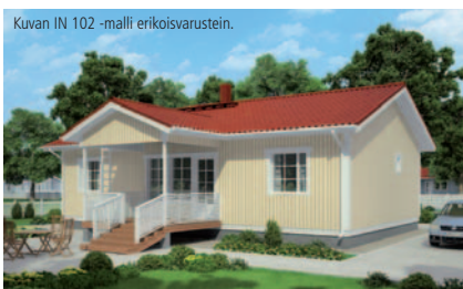
Kuvan IN 102 -malli erikoisvarustein.

Tilaratkaisultaan tehokas perheasunto 4 h + k + s, huoneistoala 102 m 2 . Avara ja valoisa olohuone, jossa takkavarauus. Vanhempien ja lasten makuuhuoneet omissa päädyissään. Keittiö voidaan toteuttaa myös olohuoneeseen yhdistyvä avokeittiönä.